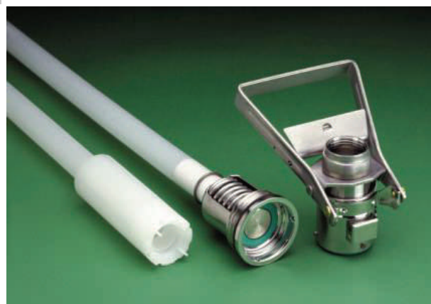
El sistema de válvulas Drum Valve de Micro Matic con el acoplador de conexión en seco para contenedores y IBC

La instalación del acoplador de conexión en seco permite un trasvase rápido y seguro de los productos peligrosos del barril al equipo dispensador.