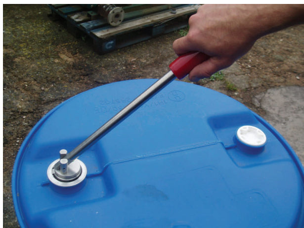
Drum Valve Entclinchwerkzeug