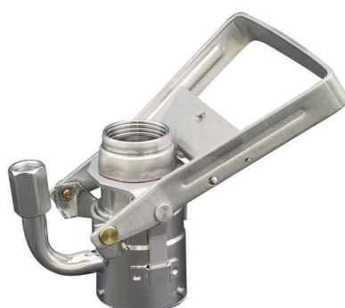
DV Kupplung mit Gaspindelanschluß