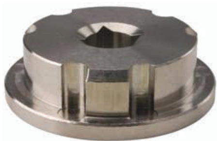
Drum Valve Ein- und Ausschraubwerkzeug 741-015

sicher, kostengünstig, einfach anzuwenden