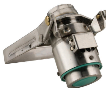
DV Kupplung 1800 mit Rückflußsicherung