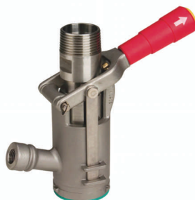
DV Füllkupplung mit Gaspindelanschluß*