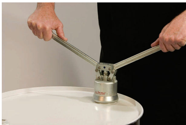
Drum Valve Clinchzange

Zur Reparatur des Ventils und zum Dichtungswechsel