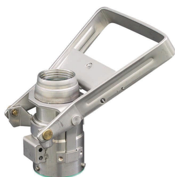
DV Kupplung - selbstbelüftend