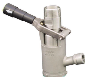
DV Kupplung Gußversion *