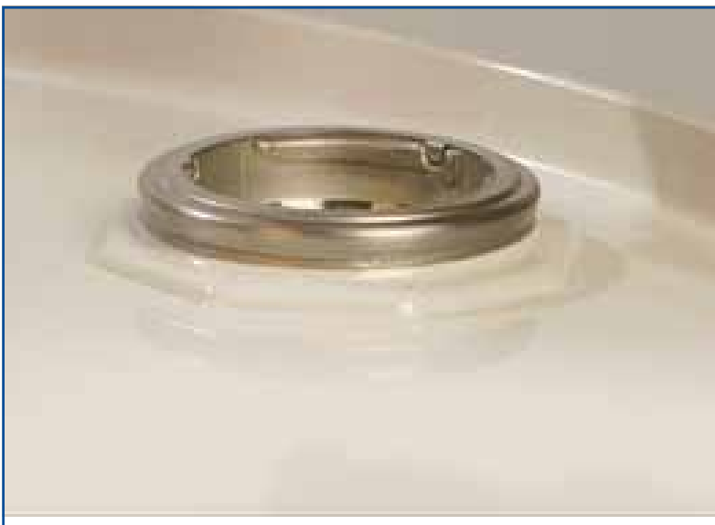
2" Stahlfäß mit Clinchring.