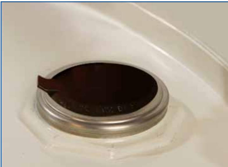
2" BSP mit Clinchring und Originalitätsverschluß.