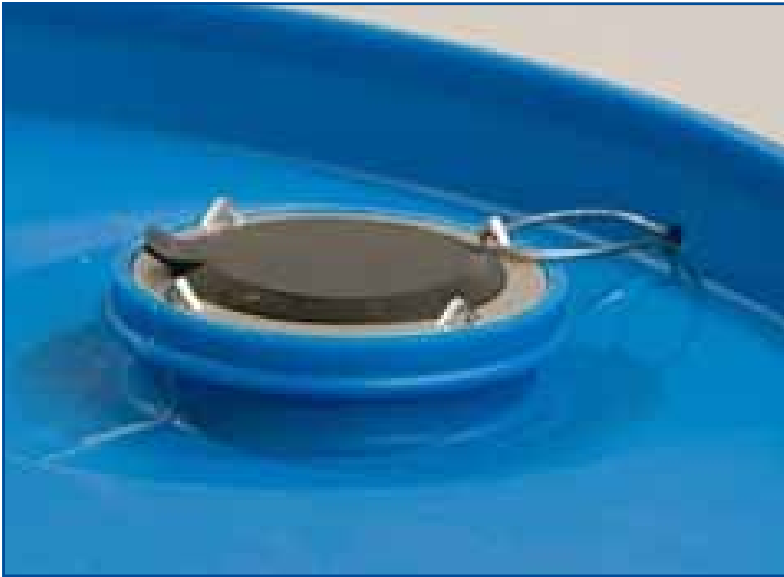
2,5x5" mit Originalitätskappe und Sicherungsdraht.