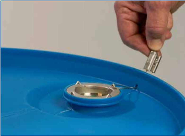
2,5x5 Anschluß im Plastikfaß mit Sicherungsdraht.