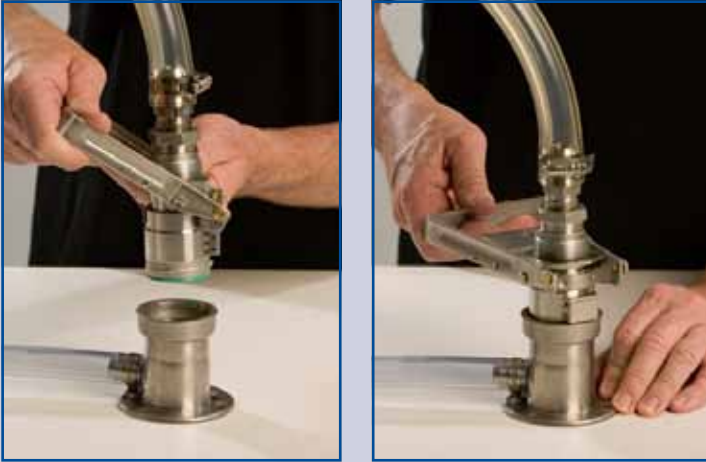
Entnahmekupplung mit Spülfuß